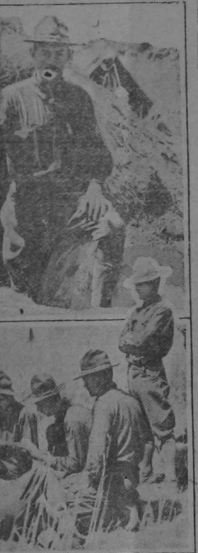
Two views of soldiers of the expeditionary forces in Mexico are shown in the accompanying pictures. The lower picture shows a group of American soldiers resting in camp after a march. For the upper picture a trooper posed for the photographer in front of a dugout, straw thatched, which he had dug to shelter himself from the low temperature which prevails in the Mexican uplands after night-fall.

SOLDIERS FIND NIGHTS G OLD MEXICO AND DIG SHELTERS.